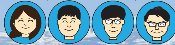
栗原市企画課 定住戦略室のスタッフ

栗原市企画課定住戦略室スタッフが、移住定住コンシェルジュの特徴をご紹介します！みなさんの希望にあったコンシェルジュを探ることができます。