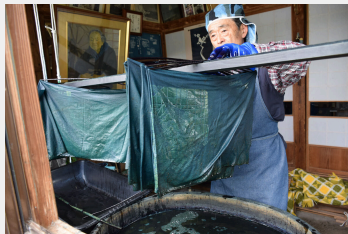
正藍冷染 (重要無形文化財)