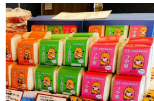
ねじりほんによ 「米キューブ」