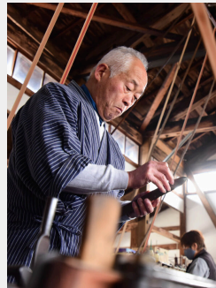
若柳地織はたや (宮城県知事指定伝統工芸品)