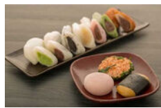
もちっ小屋でん 「しんこもち」