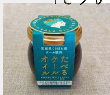
くりはうファーマーズ 「たべるケールオイル」