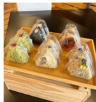
「くりはうおむすび」