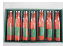
トマトハウス 夢風船 「TOMATOLOVERS」